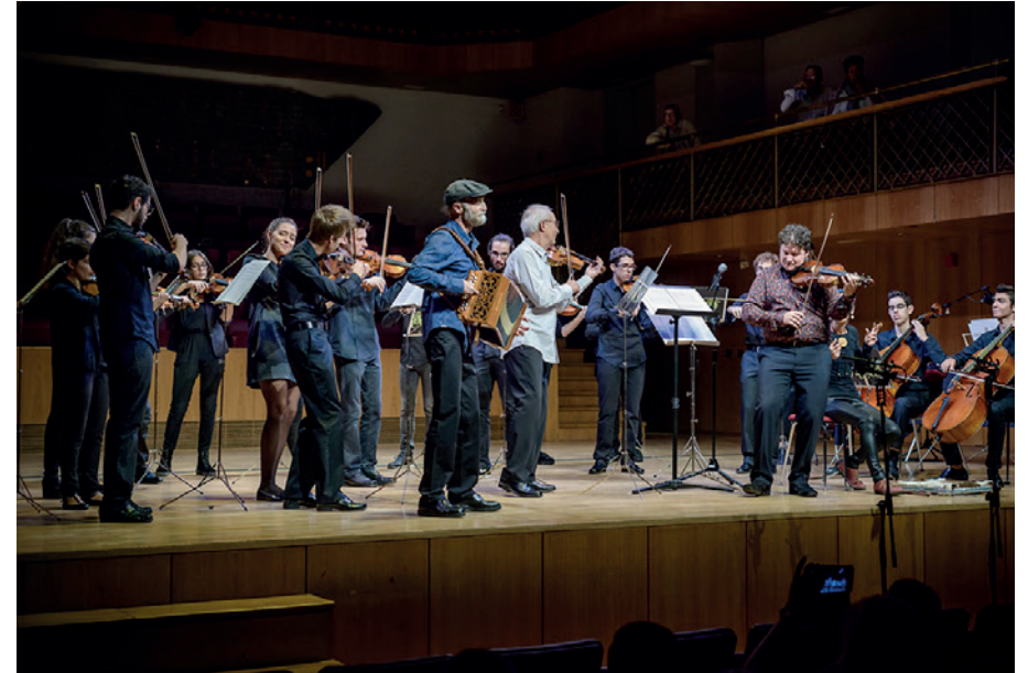
Concert de Meritxell.