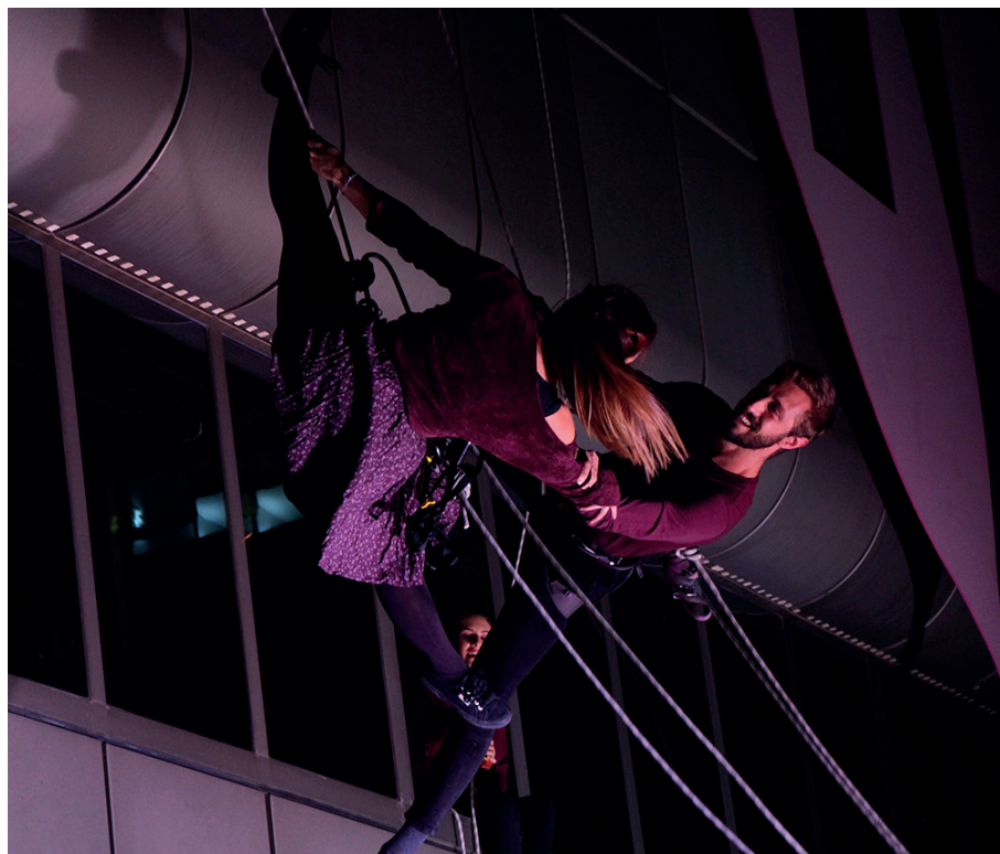
Dansa vertical.

Fundació Escena Nacional d'Andorra (ENA)