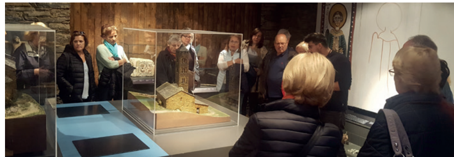
Visita guiada al Centre d'Interpretació Andorra Romànica.