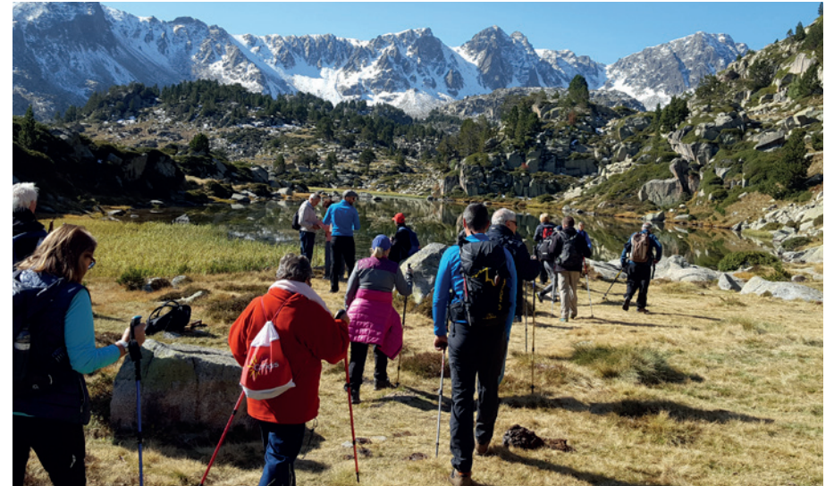
Ruta guiada de senderisme pel circ de Pessons.