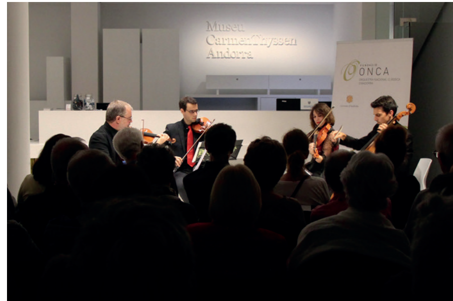
Quartet impressions. © Eduard Comellas