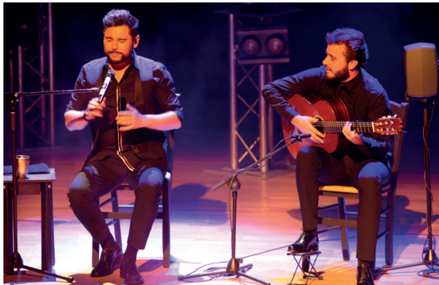
Miguel Poveda.