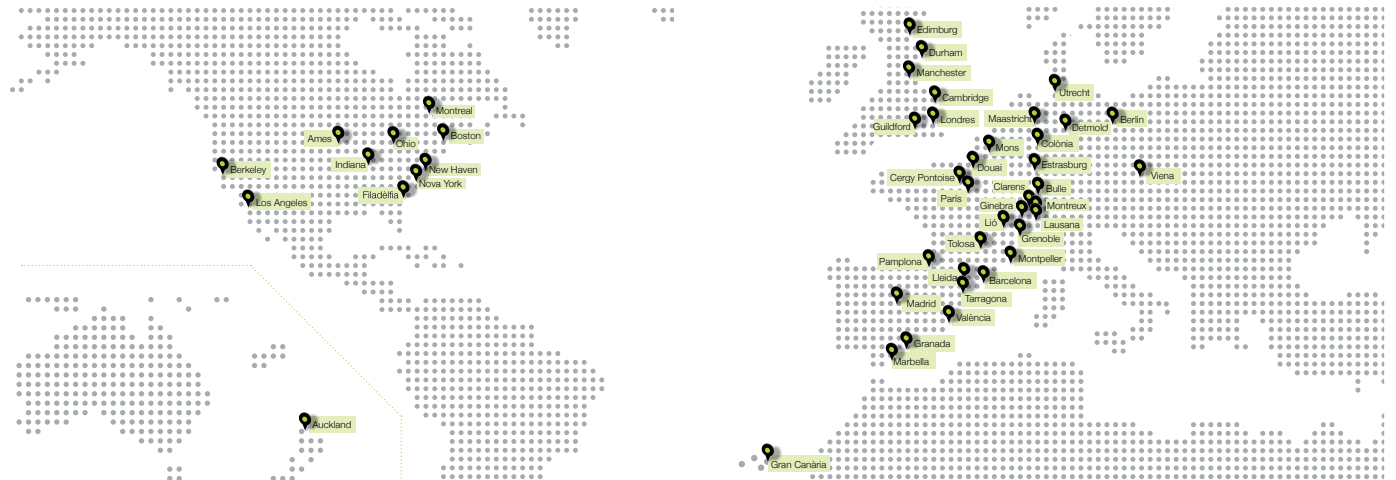
Ciutats on els becaris han cursat els seus estudis.