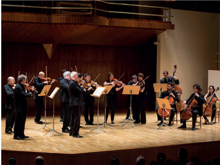
L'ONCA al Palau de la Música.