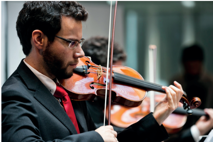
Concert de la Constitució.