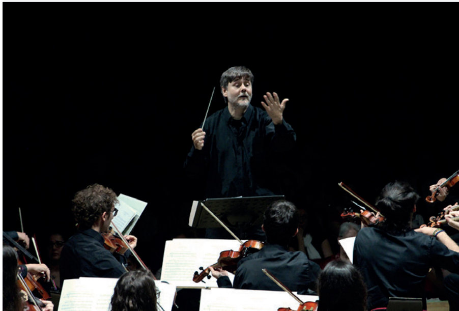
Concert de Primavera.