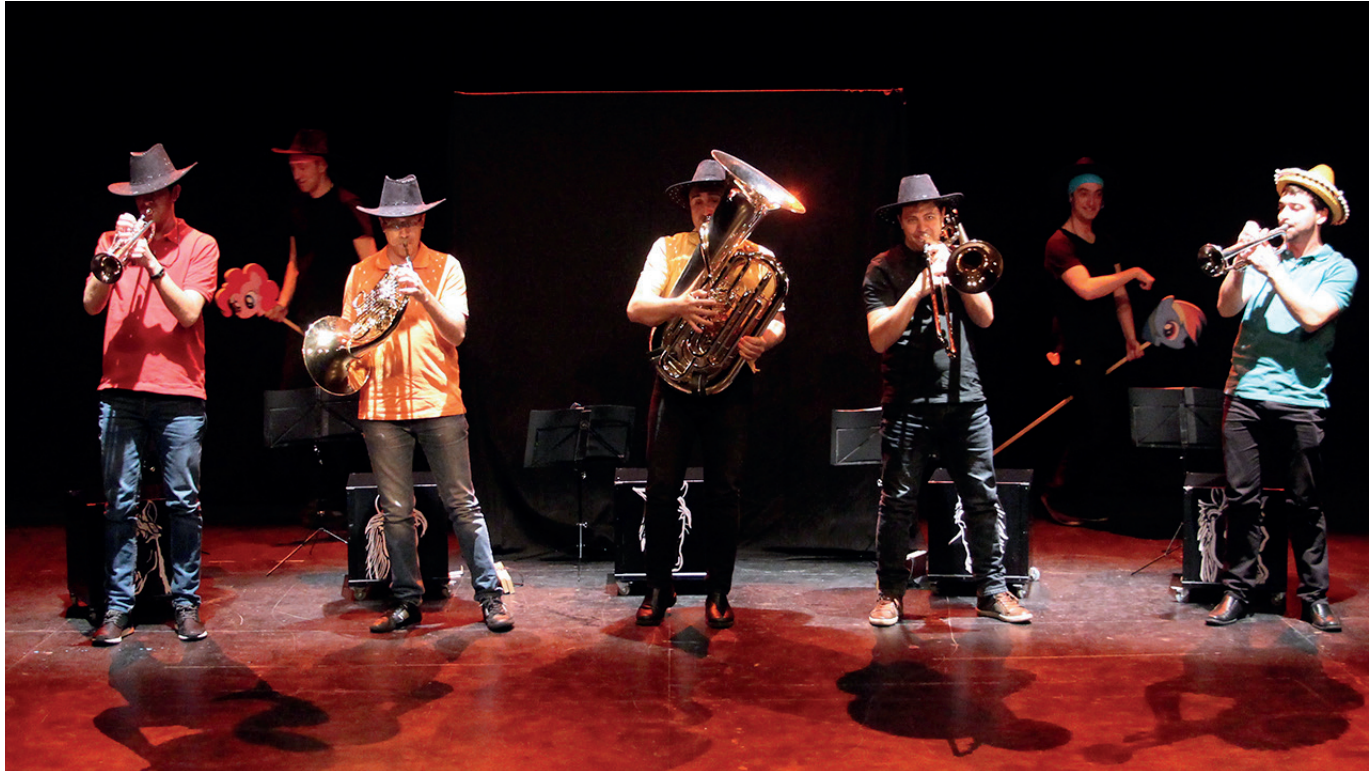
Tromponautes del cinema.