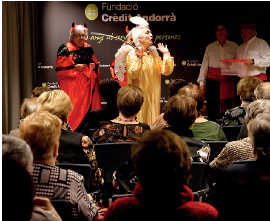
Representació teatral a la Trobada de Nadal de la gent gran.