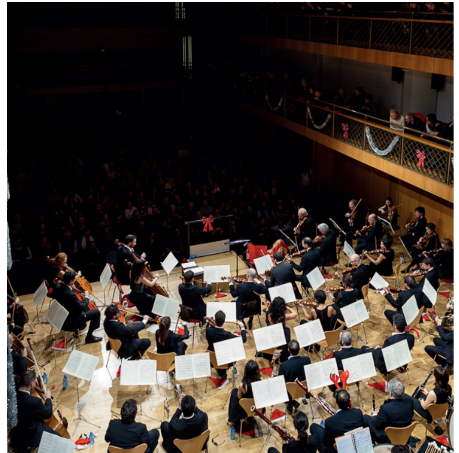
Concert de Cap d'Any.

Concert de Cap d'Any Ordino i Fundació Crèdit Andorrà