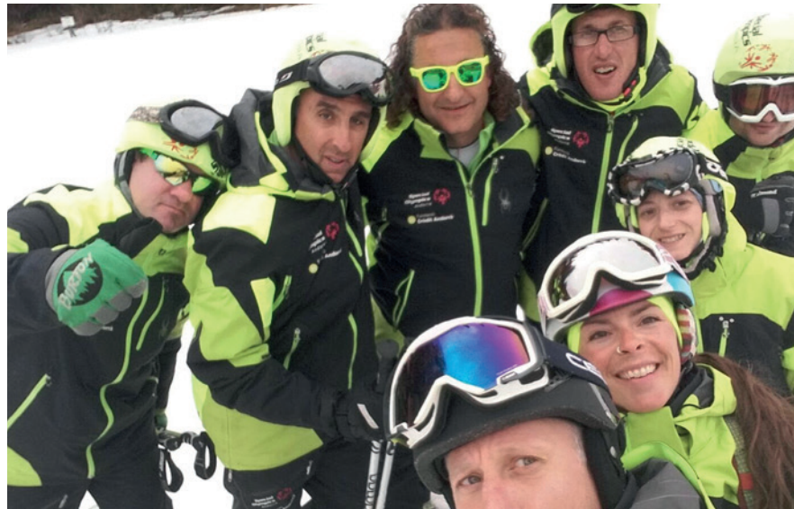
La delegació andorranca desplaçada a Àustria.