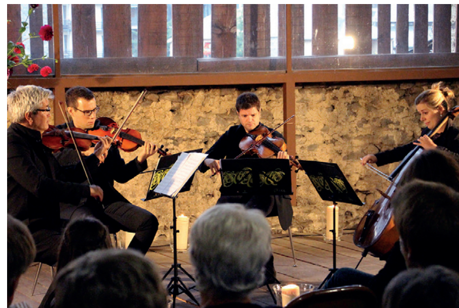
Quartet Doppler.