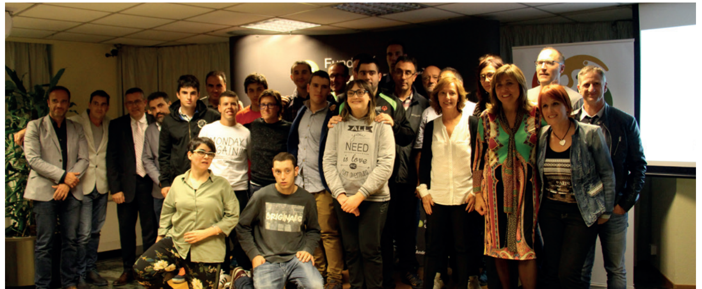
Delegació d'Special Olympics Andorra.