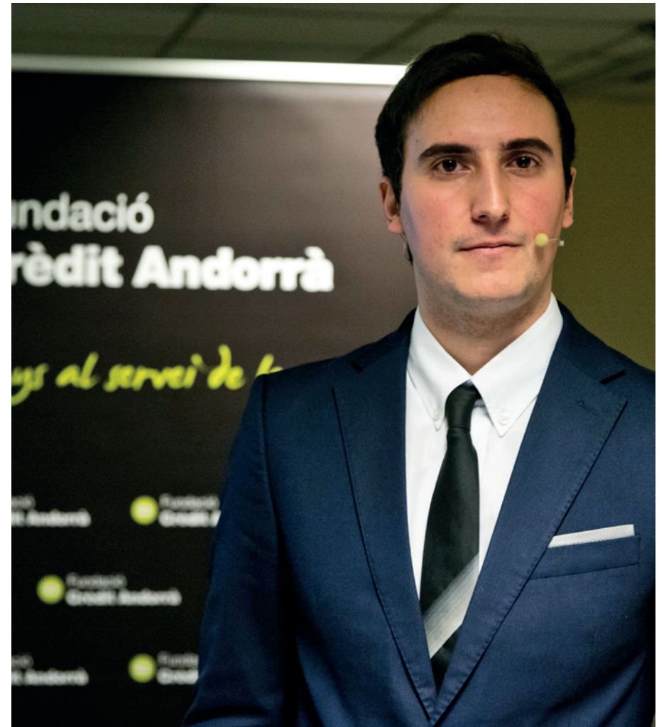
André Ribeiro. © Eduard Comellas