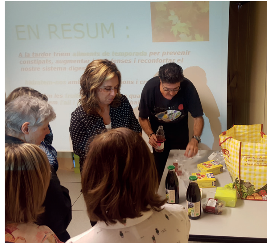
Taller Aliments de tardor . © Fundació Crèdit Andorrà