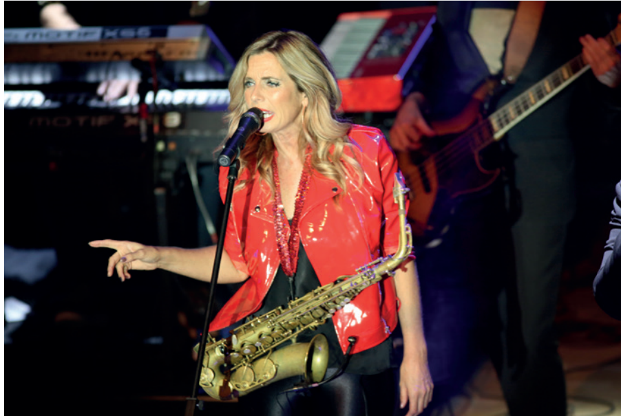
Candy Dulfer.